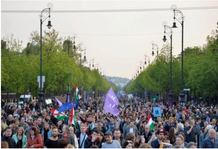
Resim 4: Protesto Yürüyüşünden (2018)

Bu tarihsel arka planın yanında bir de Macar gençlerinin, yeni bir siyasal söylem ile özgürleşme çabalarında olmaları da bu noktada önemli etkenlerden birini oluşturmaktadır. Özellikle, Rus karşıtı gösterilerin başat aktörü olan Momentum, Rus modeli bir sistemi istemediklerini yaptıkları protesto yürüyüşleri ile göstermişlerdir. 4