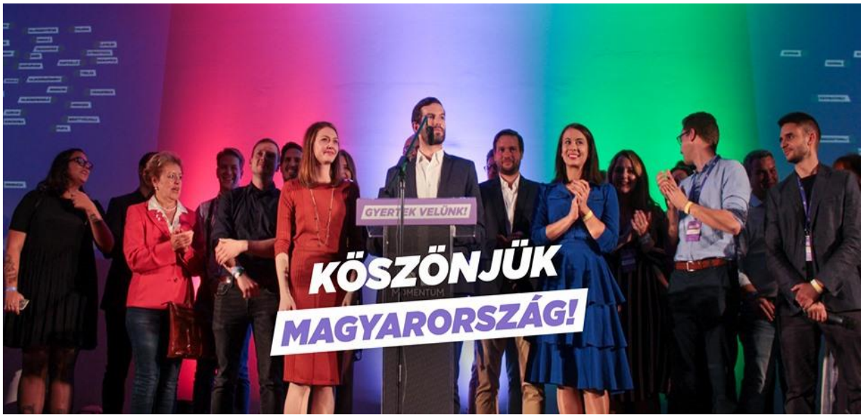
Resim 8: Anna Júlia Donáth (solda), András Fekete-Győr (ortada), ve Katalin Cseh (sağda); 13 Ekim teşekkür paylaşımı