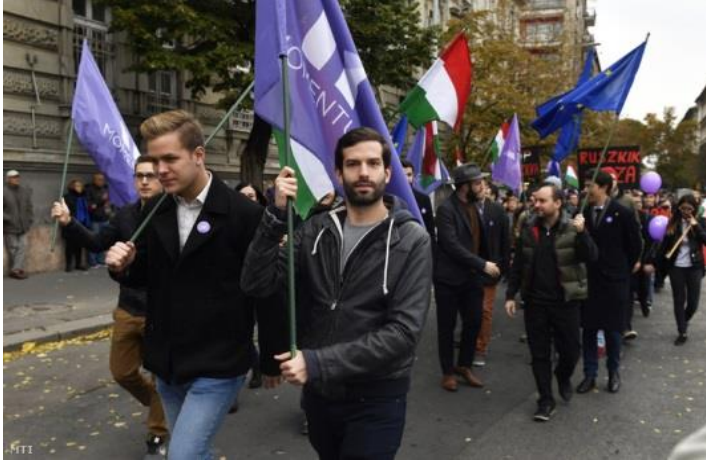
Resim 3: Momentum Başkanı András Fekete-Győr (sağ taraftaki)

2017 yılında yakalanan bu trendle birlikte partileşme sürecine giren harekette belirli konulardaki söylemler ön plana çıkmaktadır. Bunların başında gelen temel söylemler: Rus karşıtlığı ve Avrupa yakınlaşması ekseninde ortaya çıkmıştır. Kendilerini tanımlarken birçok görüşü barındırdıklarını belirterek farklılıkları da ortaya koymaktadır. 3 Rus karşıtlığı, sadece mevcut hükümetler üstünden ortaya koyulmuş bir tavırdan çok tarihsel arka planı olan bir durumu ortaya koymaktadır. 1949-1989 yılları arasında Sovyetler'in kontrolünde olan Macaristan Halk Cumhuriyeti'nin son dönemleri birçok Momentum üyesinin doğum tarihine denk gelmektedir. Yaşanılan dönemin zorlukları üyelerde doğal bir karşıtlığı ortaya çıkarmıştır.